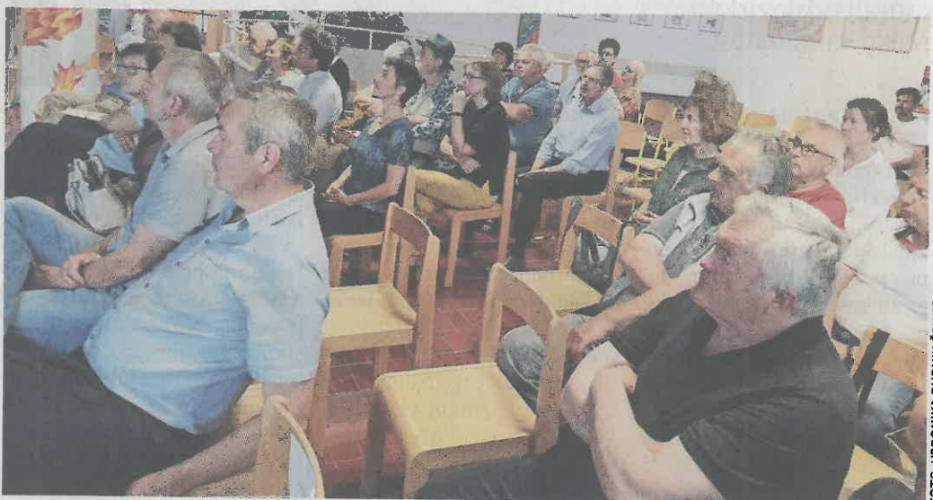
Na okrogli mizi, ki je pritegnila precej ljudi, so se zavzeli za interdisciplinarno in vključujočo prenavo kraških vasi, ki ohranja dediščino, izboljšuje zunanji javni prostor ter kakovost bivanja ljudi.